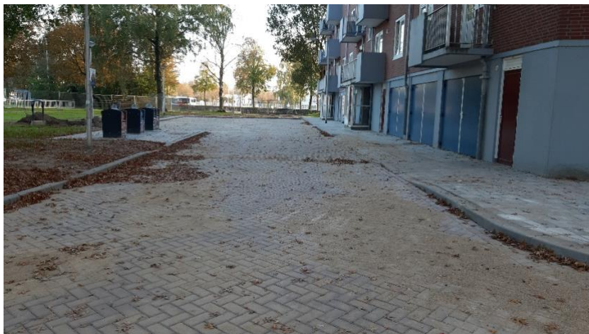
1e fase bestrating nabij Generaal Smutslaan 328

Bij aanvang van onze werkzaamheden zagen we de kans om de overlast voor de omgeving aanzienlijk te verminderen. Doordat we vroegtijdig extra werkzaamheden verrichtten aan de Nuts leidingen beperkten we het openbreken van de straat tot slechts één keer. Het project duurt daardoor weliswaar iets langer, de belemmering voor het verkeer aanzienlijk korter.